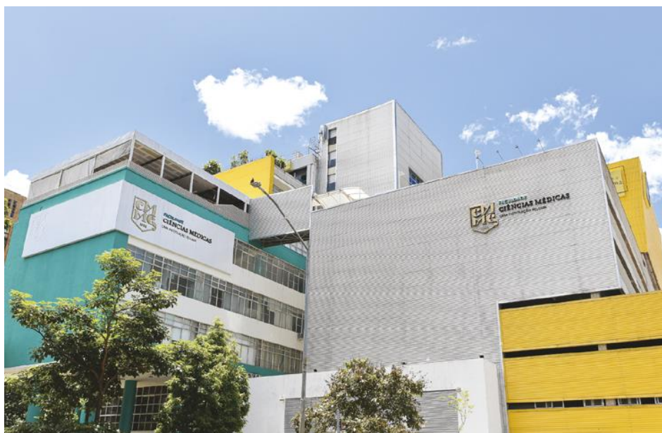
Figura 1 – Fachada da Faculdade Ciências Médicas de Minas Gerais – Campus I