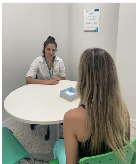
Figura 11 – Sala de atendimento do NAAP

O objetivo do Núcleo de Acessibilidade e Apoio Psicopedagógico da Faculdade Ciências Médicas de Minas Gerais (FCMMG) é oferecer apoio psicopedagógico aos estudantes durante a sua formação. O discente pode buscar de dificuldade, sofrimento psicológico ou pedagógico. O NAAP se dedica a refletir sobre acessibilidade e inclusão em seus diferentes níveis, seja nas barreiras sociais, estruturais ou pedagógicas.