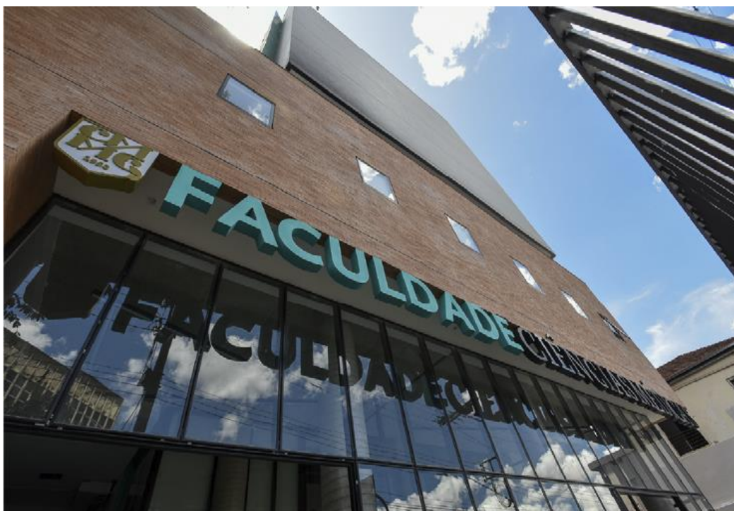
Figura 2 – Fachada da Faculdade Ciências Médicas de Minas Gerais – Campus II

Em 10 de fevereiro de 2022, a FELUMA, mantenedora da FCMMG, inaugura o Campus II da Faculdade, que já no primeiro dia de funcionamento recebeu cerca de oitocentos discentes para assistir as aulas e prestar atendimento à população na nova estrutura, dotada de acomodações modernas e informatizadas incluindo 22 salas de aula, 76 consultórios, 6 salas de bloco cirúrgico, sala de fisioterapia, auditório, deck, jardim e refeitório. Com ótima localização, o novo Campus está na Av. dos Andradas 1.093 – Centro – BH. Além disso, outros mil e quatrocentos alunos foram recebidos no Campus I, localizado na Alameda Ezequiel Dias