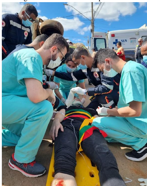
Figura 10 – Atividade Complementar

As atividades Complementares têm por objetivo assegurar a flexibilidade e a qualidade da formação oferecida aos estudantes, com vistas a obter uma progressiva autonomia profissional e intelectual dos mesmos, por meio de estudos independentes, que devem ser cumpridos ao longo do curso de graduação.