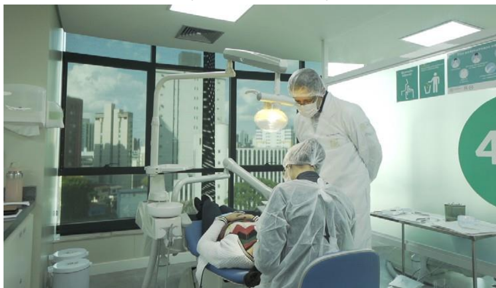
Figura 7 – Curso de Odontologia

A Ciências Médicas, que já oferece cursos de pós-graduação em todas as áreas da Odontologia, amplia o ensino também para a graduação. O Projeto Pedagógico do Curso de Odontologia oferece métodos e práticas inovadoras, diversos cenários de aprendizagem e matriz curricular alicerçada em eixos pedagógicos que contemplam as necessidades de desenvolvimento de competências e habilidades essenciais, incluindo práticas laboratoriais, clínicas assistenciais e estágios. A integração das atividades de ensino ao Sistema Único de Saúde ocorre desde o primeiro ano do curso com ações de prevenção e promoção da saúde. A matriz curricular permite ainda o desenvolvimento de habilidades técnicas e capacidade de planejamento em nível integral.