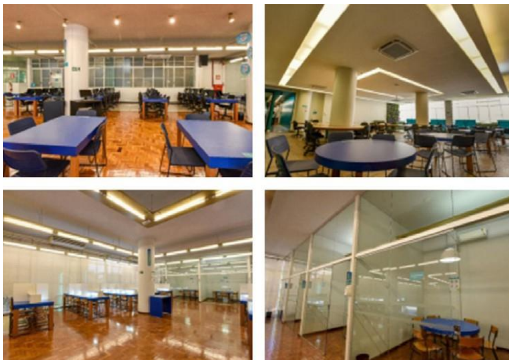
Quadro 1 – Biblioteca FCMMG