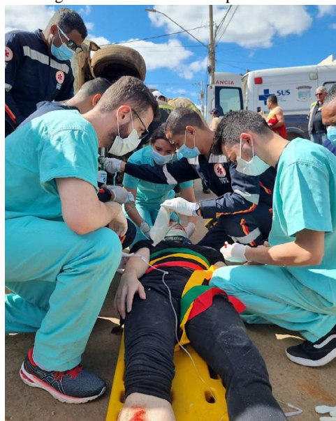
Figura 10 – Atividade Complementar

As atividades Complementares têm por objetivo assegurar a flexibilidade e a qualidade da formação oferecida aos estudantes, com vistas a obter uma progressiva autonomia profissional e intelectual dos mesmos, por meio de estudos independentes, que devem ser cumpridos ao longo do curso de graduação.